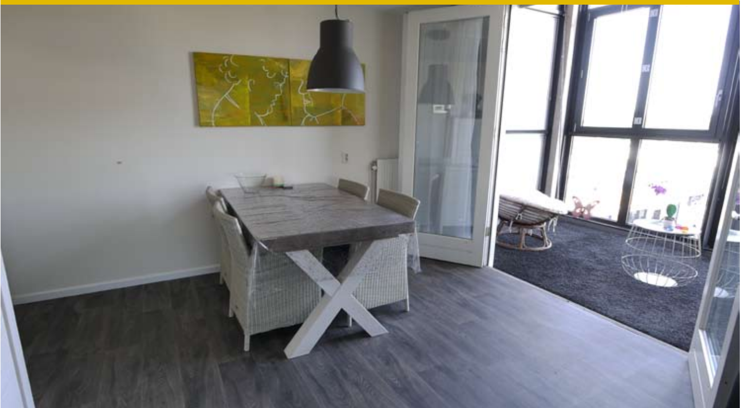
Eethoek / Serre