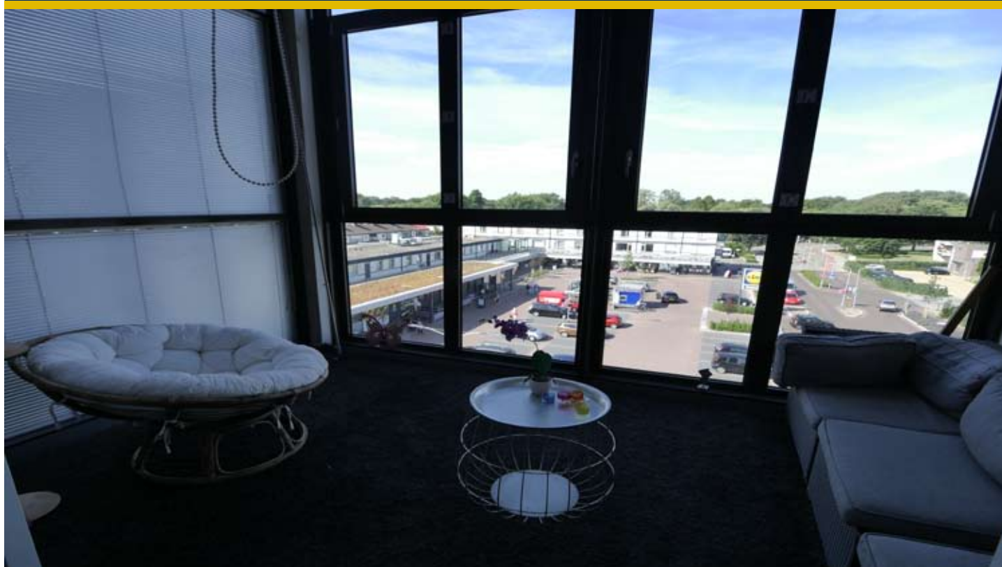
Serre met uitzicht